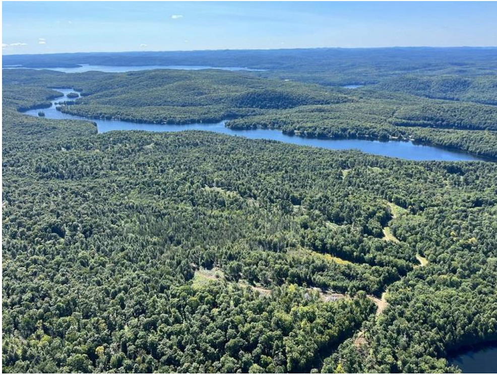
Photo du site de forage en avant-plan du Lac Doré et du Lac Simon

Par la présente, nous vous soumettons notre mémoire comprenant nos commentaires et recommandations concernant la consultation sur l'encadrement minier que vous avez annoncée le 17 février 2023.