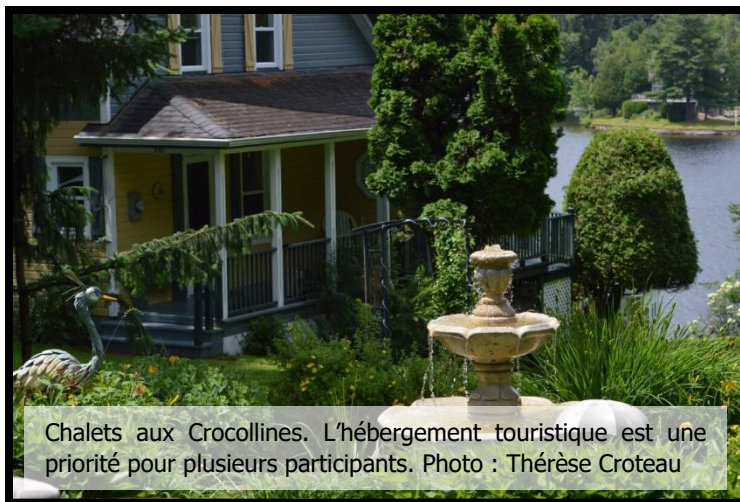
Chalets aux Crocollines. L'hébergement touristique est une priorité pour plusieurs participants.

Parmi les points soulevés aux quatre périodes, il y a l'hébergement touristique. Les participants semblent d'accord pour dire qu'il s'agit d'une nécessité afin de répondre aux besoins des visiteurs dans la région. Il y a, en ce moment, peu d'offres d'hébergement. Parmi les idées avancées figure également celle de voir à développer l'offre de nuitées en hébergement non traditionnel, comme des tipis ou des yourtes, qui pourraient attirer des gens été comme hiver. C'est d'autant plus pertinent que les campings de Lac-Simon ont pour la plupart des emplacements non locatifs, c.-à-d. que les gens qui les occupent y demeurent tout l'été et ne sont pas de simples visiteurs.