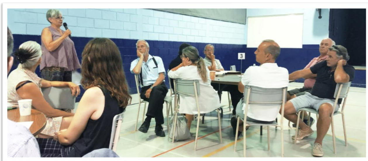
La Municipalité a mené plusieurs assemblées publiques de consultation durant l'été 2019 en amont de la révision du plan et des règlements d'urbanisme. Cette photo a été prise à l'assemblée tenue le 3 août.