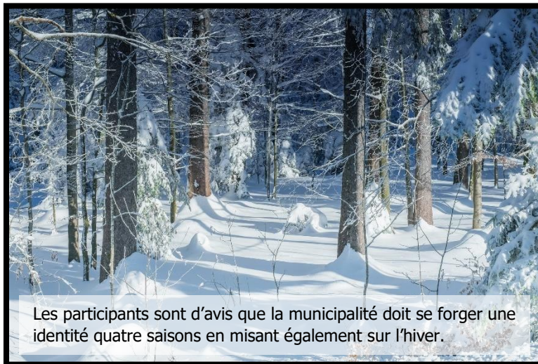
Les participants sont d'avis que la municipalité doit se forger une identité quatre saisons en misant également sur l'hiver.

Il a été soulevé qu'à l'instar de n'importe quel autre milieu de vie ou destination touristique prisée, Lac-Simon devrait se doter d'une identité propre et définir certaines valeurs qui la caractérisent (un branding ), dans le but de se « positionner » au sein de la région. Il est souligné que malgré le caractère majestueux de ses cours d'eau, l'attrait de Lac-Simon ne s'y limite pas. Parmi les valeurs à définir devrait figurer le désir d'être un milieu de vie habité et invitant à longueur d'année, et non seulement en haute saison comme c'est surtout le cas en ce moment. Il est