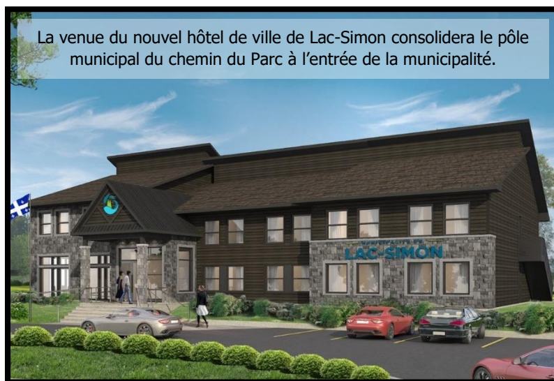
La venue du nouvel hôtel de ville de Lac-Simon consolidera le pôle municipal du chemin du Parc à l'entrée de la municipalité.

Les participants ont eu à répondre à une question concernant l'avenir du nouveau pôle municipal (nouvel hôtel de ville, caserne, écocentre). Une majorité semblait d'accord pour dire que ces terrains de propriété municipale devraient faire l'objet d'une planification et être développés pour répondre à des besoins actuels et projetés. En outre, l'idée de permettre la construction de résidences pour aînés sur ces terrains est soulevé. Une citoyenne estime que ces terrains non riverains seraient un bon endroit pour permettre le développement de logements moins onéreux