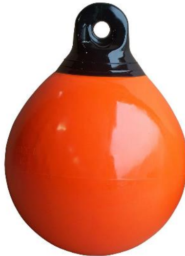
Figure 2: Bouée Deck Edge de 18 pouces