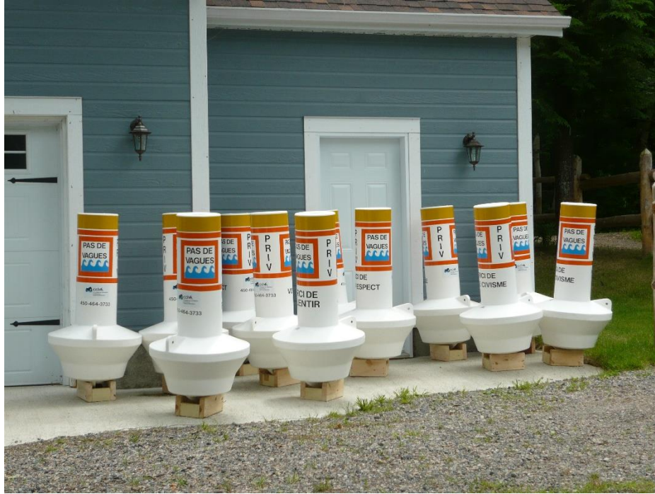
Figure 5: Bouée de type « robuste »

Le cinquième type de bouée est celui de type « robuste ». La différence avec celle de type « chandelle » est qu'elle est plus résistante aux grandes vagues et demeure plus facilement en cas de courant fort. Ce type de bouée pourrait être envisagée pour les lacs Gagnon et Simon, sujets à des plus forts vents. Il est possible d'ajouter un lettrage simple, par exemple une photo de myriophylle à épis.