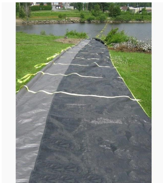
Figure 9: Exemple de barrière à sédiments hors de l'eau