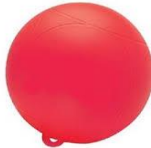
Figure 1: Ballon marqueur 12 pouces ou 15 pouces