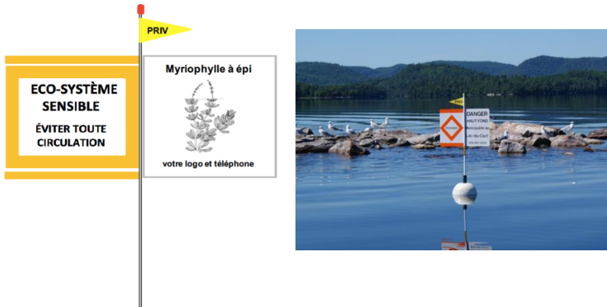
Figure 4: Bouée riveraine avec identifiant Myriophylle à épis

Le quatrième type de bouée et celui de type riverain avec un identifiant préfabriqué pour le myriophylle à épis. L'ancre et la corde sont comprises avec l'achat de la bouée.