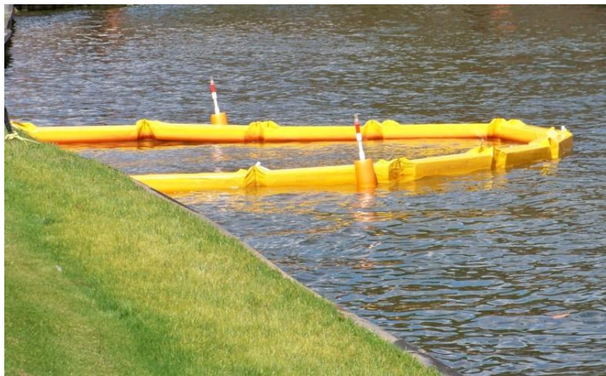
Figure 8: Exemple de barrière à sédiments installée dans un plan d'eau