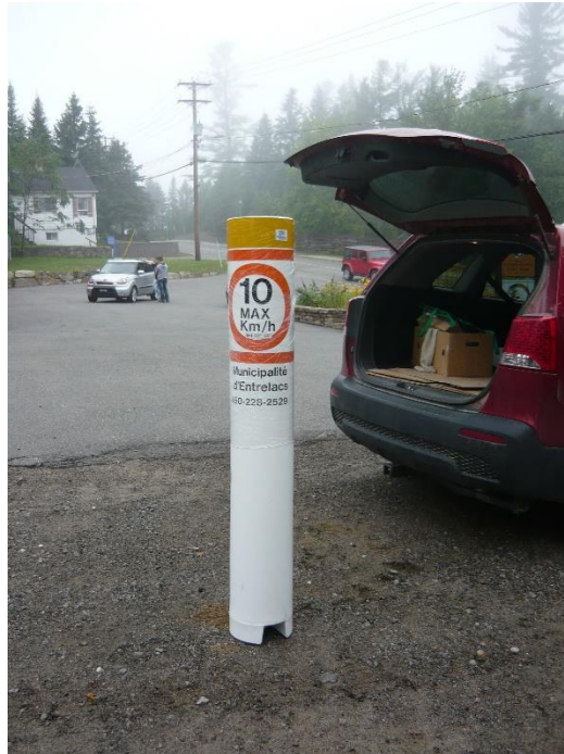
Figure 3: Bouée type « chandelle »