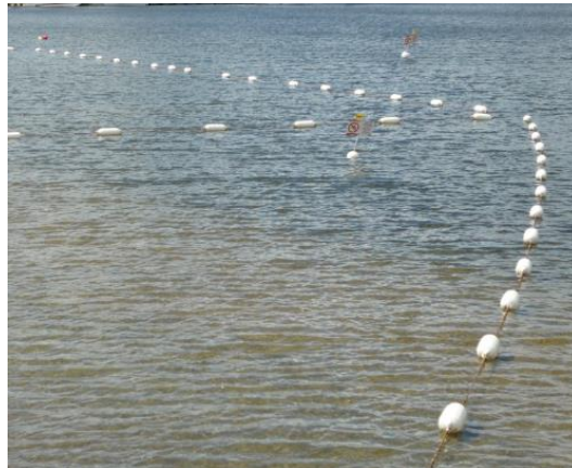
Figure 6: Flotteurs de délimitation de plage (Nordak Marine)

La deuxième option est l'installation de flotteurs de délimitation de couleur jaune au périmètre du secteur à circonscrire. Cette méthode permet de mieux ceinturer l'espace où l'on veut éviter le passage des usagers du plan d'eau que la méthode par l'installation de bouées comme présentée pour l'option 1. Il est toutefois possible de jumeler l'option 2 avec une bouée de l'option 1.